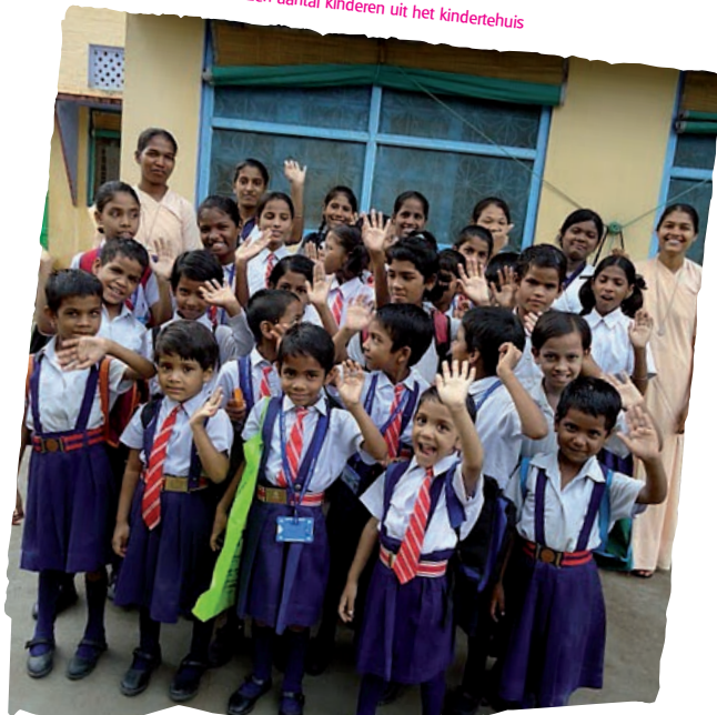
Een aantal kinderen uit het kindertehuis