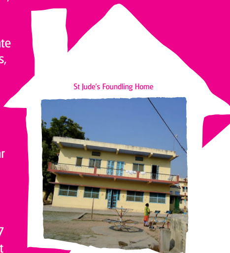
St. Jude's Foundling Home