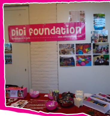
Kraampje internationale vrouwendag

Daarom hebben we met een kraampje met spulletjes uit India gestaan op de internationale vrouwendag georganiseerd door het TBL.