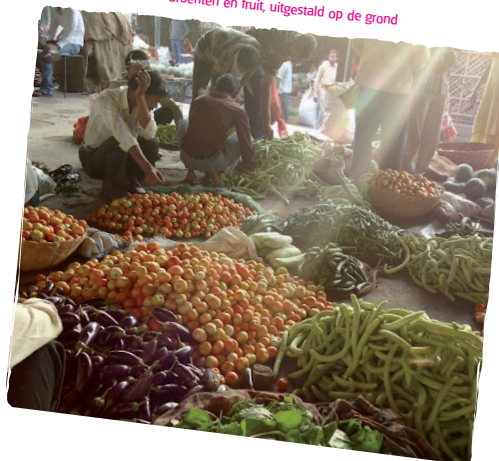
Groenten en fruit, uitgesteld op de grond

Wil je Didi Foundation helpen en bijdragen aan het motto 'Ik een kans, zij een kans'? Word dan donateur en maak maandelijks een vast bedrag over. Dat kan op rekeningnummer 1388.20.805 van de Rabobank ten name van Stichting DiDi foundation, o.v.v. 'vermelding' of 'anoniem'. De huidige donateurs ontvangen binnenkort een uitnodiging voor een homemade Indiaas diner, als dank en waardering voor hun trouwe steun.